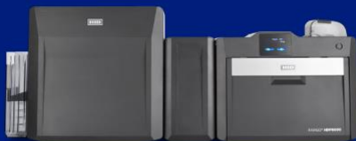
Kétoldalas nyomtató / kódoló lamináló modulal