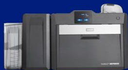
Kétoldalas nyomtató / kódoló

A HDP6600 a HID Global innovatív, optimalizált laminálási technológiát alkalmazza, így nincs szükség a szabványos hordozó fóliára. A HDP6000 jelenleg az egyetlen olyan nyomtató a piacon, amely optimalizált laminálási technológiát alkalmaz, ezzel 40%-kal csökkentve a lamináláshoz szükséges kellekek költségét. A kellékanyagok költséghatékonyságán túl a PolyGuard LMX laminátum a legmagasabb szintű élettartamnövelő védőbevonatot képi a kártyán.